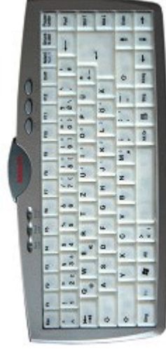
KeySonic Illumintaed Mini Keyboard & Okion NightOwl Multimedia Keyboard