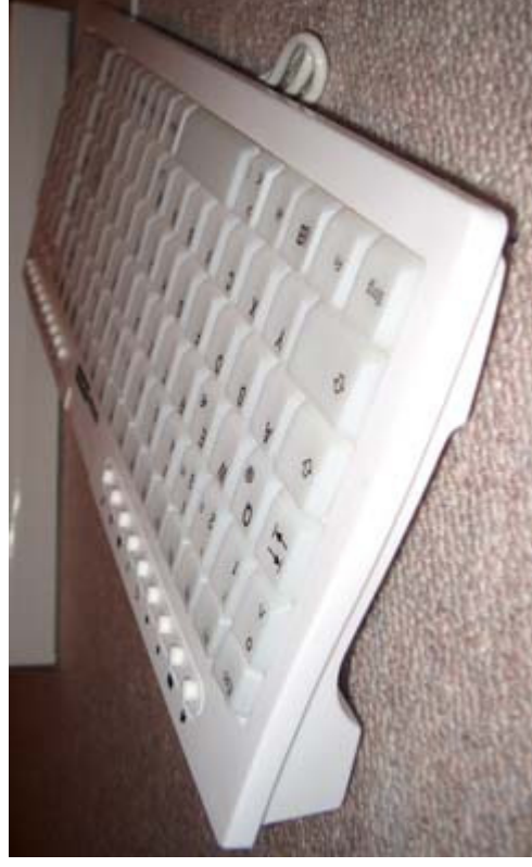
Stilstudie der Tastatur