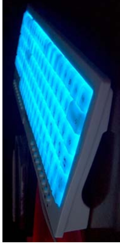
Okion NightOwl Multi-Media Keyboard bei eingeschalteter Beleuchtung