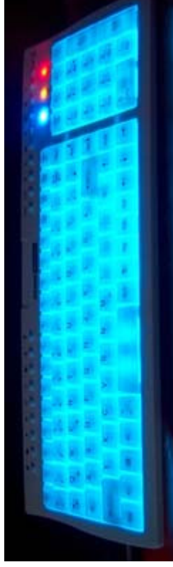
Okion NightOwl Multi Media Keyboard bei eingeschalteter Beleuchtung + Led's eingeschaltet